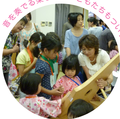
曲を奏でる楽しみに子どもたちもついつい夢中になる

ヘルマンハーブは、楽譜を左右にスライドさせるだけで、簡単に移調することができます。音の変化のおもしろさを体感したり、子どもの声域に合わせて歌を演奏することができます。