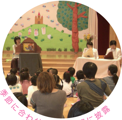
季節に合わせた曲を手軽に披露