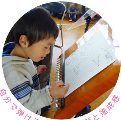
自分で弾けることへの喜びと達成感