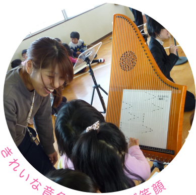
きれいな音色にみんなが笑顔